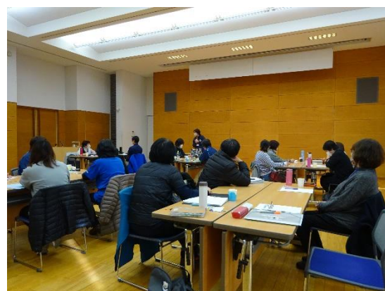
春日・市島地域のケアマネさん達

東部圏域ケアマネジャー連絡会に参加しました。高齢者の方が増えていく中で、ケアマネジャーさん達も同職種との連携や地域との連携を大切にされています。こういった専門職の方々とのつながりを大切にしながら、いつまでも安心して暮らせる地域となるよう、地域作りを進めていきたいと思えます。