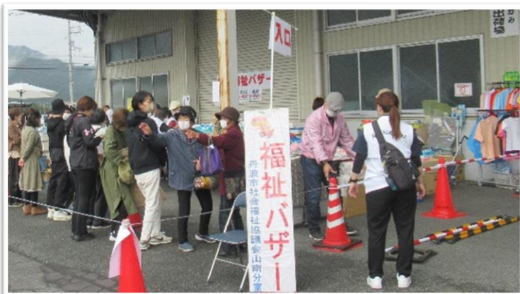
【山南】農協まつりと同会場にて開催