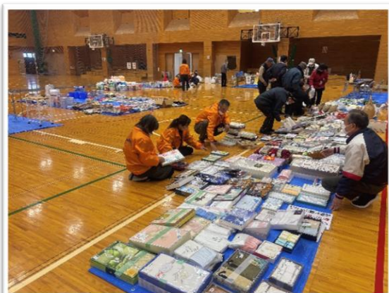
【柏原】住民センター体育館での事前準備

丹波市社協ではご家庭にある未使用品や野菜等を提供いただき、販売する福祉バザーを町域ごとに開催しています。物品の収集や会場の設営、値付け、そして当日の運営など民生委員児童委員をはじめ、福祉委員、自治会長、ボランティアグループなど様々な方のご支援を賜り、開催することが出来ました。当日は多くの方にご来場いただきました。関わってくださった皆様、本当にありがとうございました。