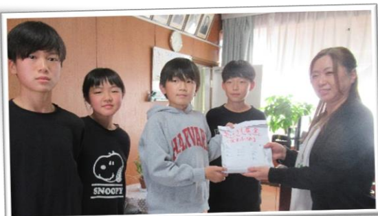
【久下小学校児童会の皆様】「有効に活用してほしい」というお言葉も合わせてお受け取りしました。