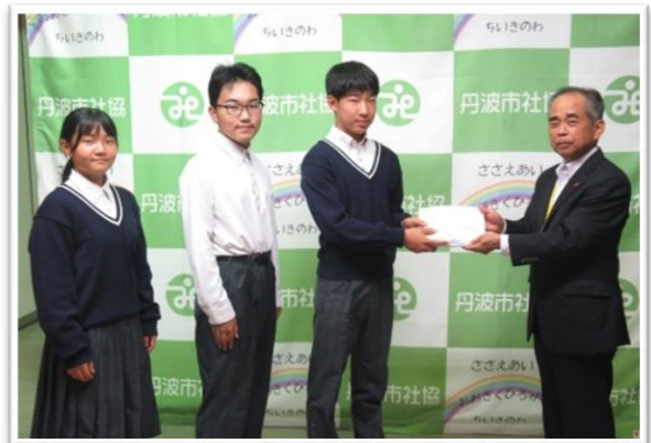
【柏原中学校の皆様】

10月1日より全国一斉に共同募金運動が始まり、住民の皆様や企業、学校など“ふくし”に関心を持つ機会として様々な所で運動を行っています。小学校や中学校にもご依頼を行い、生徒の皆様からもご協力を頂いているところです。集まった募金は小学校等での福祉学習や認定こども園の保育材料の購入、ボランティアグループの活動の助成事業等に活用させていただきます。