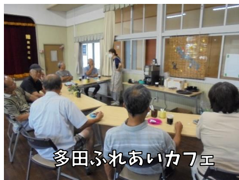
多田ふれあいカフェ