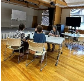
綺麗なお花もお家から✿