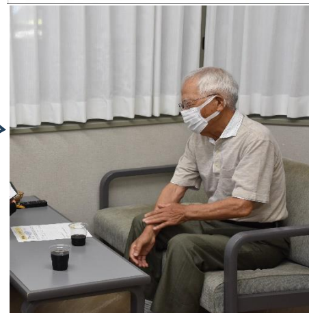
お話しを聞かせていただきました

こういう取組みを通じて、地域の皆さんが安心して暮らせる地域が広がっています。地域の方々の声を大切にしながら、今後も協議を続けていきたいと思ひます。