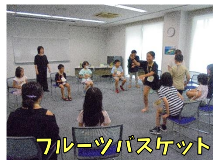
フルーツバスケット