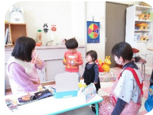
兄妹で預かりの場合は、協力会員は2名で対応します。