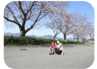
天気のいい日は、センターの周辺を散歩したりします。