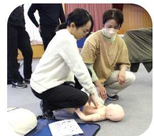
乳幼児の人形で実践を行いました