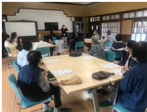
栗住野栗の実会 男性の参加があり活気があります。