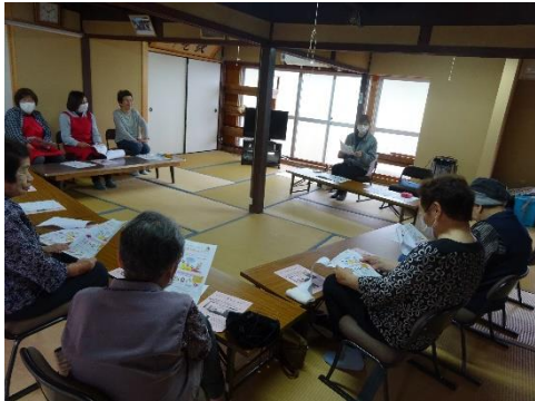
大正町にここサロン 夫婦そろって参加されています。