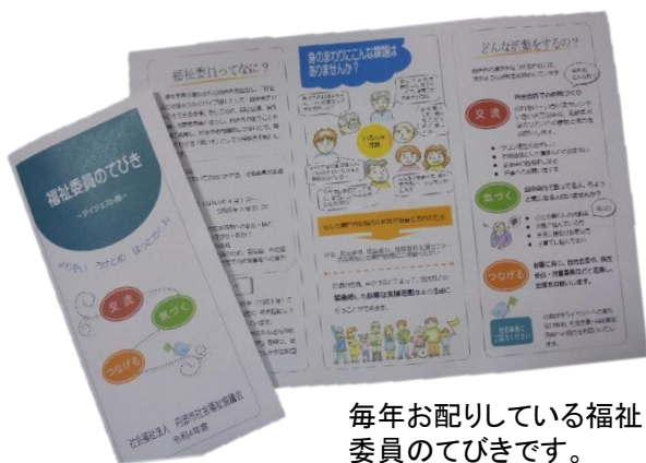
毎年お配りしている福祉委員のてびきです。