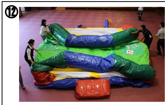
⑫ 送風機のスイッチを入れて本体を膨らませる。膨らませながら、本体を四方から引っ張って伸ばす。