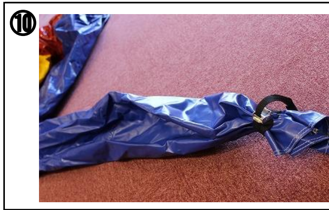
⑩ 本体の送風口の片方を空気が漏れないように縛る。