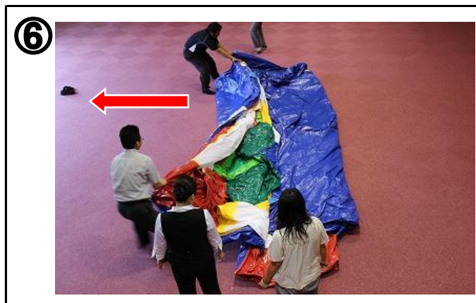
⑥ 3つ折りされているので、左右に広げる。