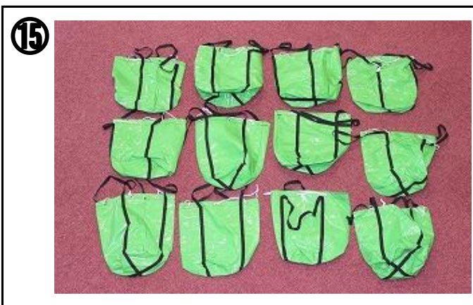
⑮ 本体6箇所(屋外180kg以上)に取り付ける。砂袋には、水の入ったペットボトルを入れるなどして十分な重さを確保する。