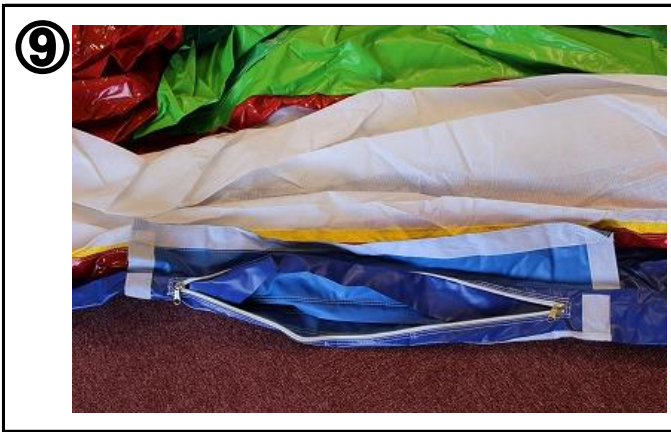
⑨ 本体の左右にあるチャックを閉め、マジックテープ部分を合わせる。