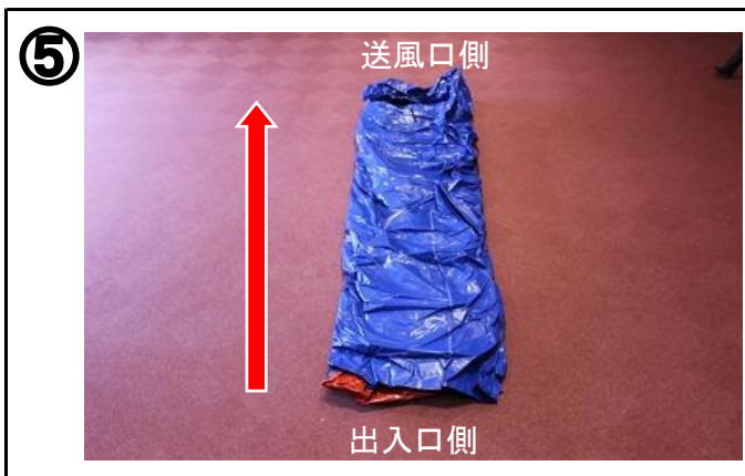
⑤ 出入口側から送風口側に向かって広げる。