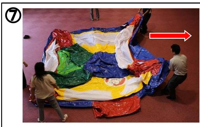
⑦ 3つ折りされているので、左右に広げる。