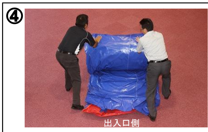
④ グラウンドシートの上に本体を広げる。汚れ予防のため靴を脱いで作業して下さい。