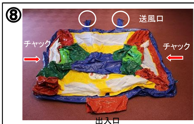
⑧ 本体(5m×5m)がグラウンドシート内にあることを確認する。