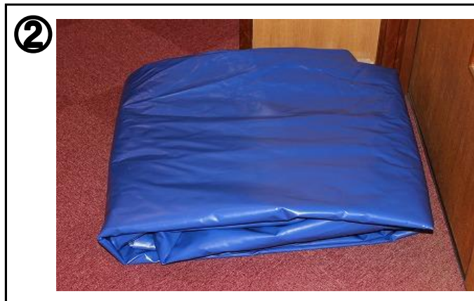
② 地面に突起や石などがいないかを確認し、平坦な場所にグラウンドシート(6m×6m)を敷く。