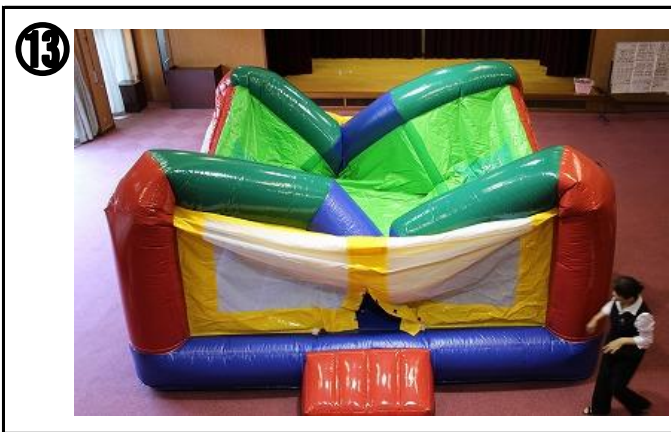
⑬ 徐々に膨らんで5～10分で完成する。