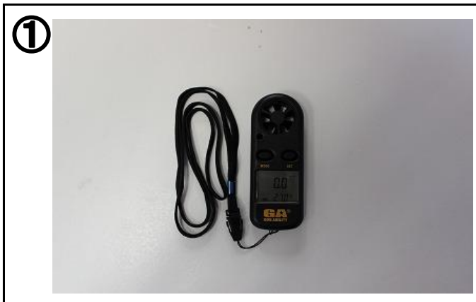
① 風速計で計測し、瞬間風速8m/秒以下であることを確認する。精密機器なので落下・衝撃・水に注意する。