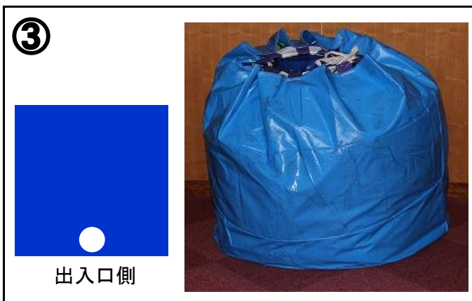
③ 本体をグラウンドシートの中央端(出入口側)に設置し、袋から取り出す。シートの上は靴を脱いで下さい。