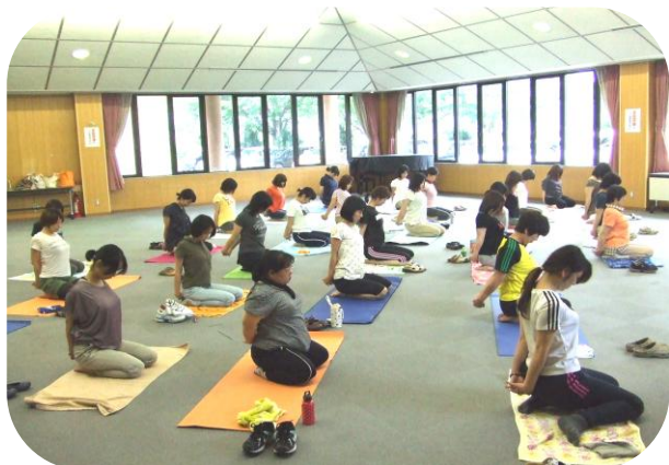
日頃の子育てから離れて、自分と向き合います！