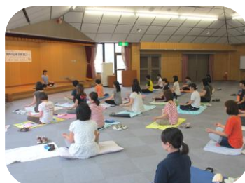
気持ちを落ち着かせます。 無の境地！