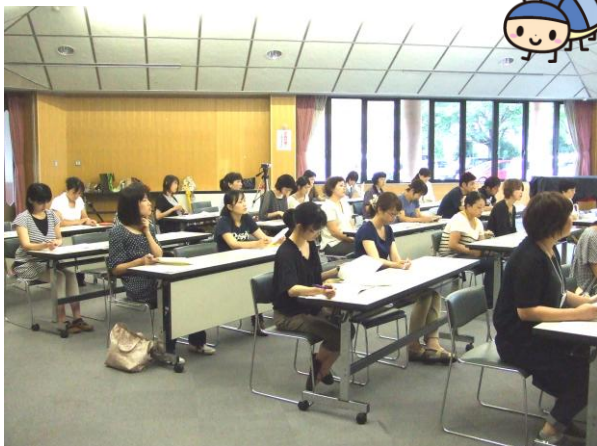
『ママのおしゃべり救急箱』（全6回開催）