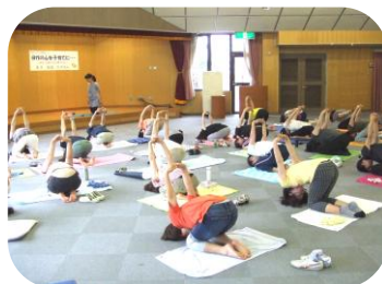
身体を伸ばします。 気持ちいい〜♪