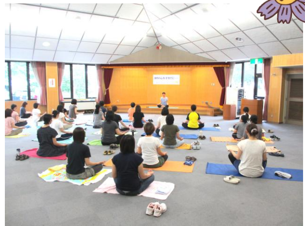
『フォローアップ講習会』 ヨガの心を子育てに...